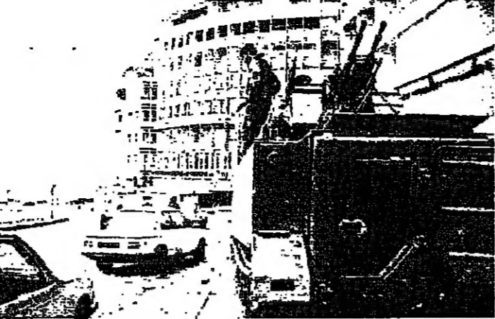
ملاة القوة الضاربة في الروشة ■ الحركة في الحمراء